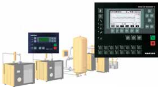
Системы управления компрессорами с интернет-технологией