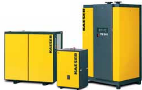
Холодоосушитель с энергосберегающей системой регулирования SECOTEC