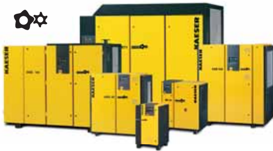
Винтовые компрессоры с SIGMA PROFIL