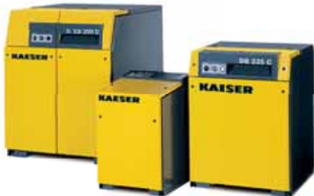
Роторные воздуходувки с OMEGA PROFIL