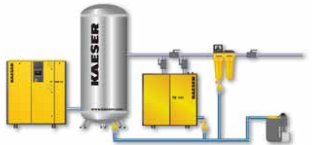
Подготовка сжатого воздуха (фильтр, подготовка конденсата к утилизации, адсорбционный осушитель, адсорбер на активированном угле)