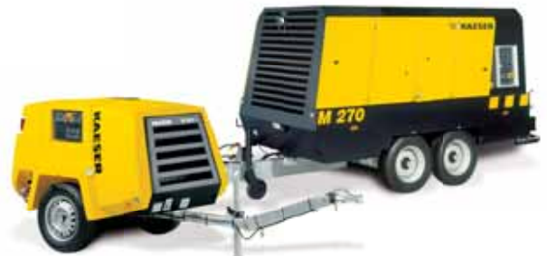
Передвижные строительные компрессоры с SIGMA PROFIL