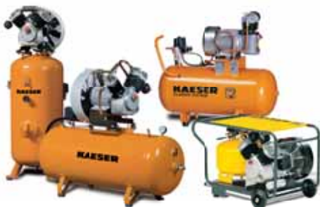
Поршневые компрессоры для небольших производств и мастерских